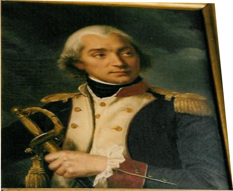
De Franse generaal Pichegru marcheerde Beek en Esbeek binnen op 27-9-1794