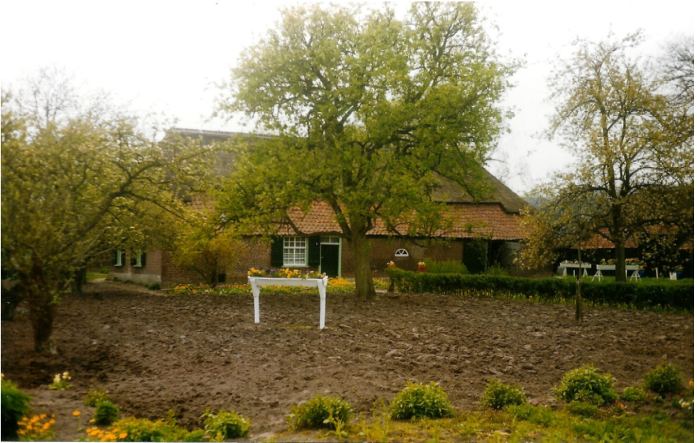
Boerderij Hendriksen nog fier overeind na de gigantische storm van augustus 1674.

De muren van de bakoven waren omgevallen en het dak was gewoon verdwenen. Vervolgens noteerde de Beekse schepen nog de volgende geconstateerde schade: